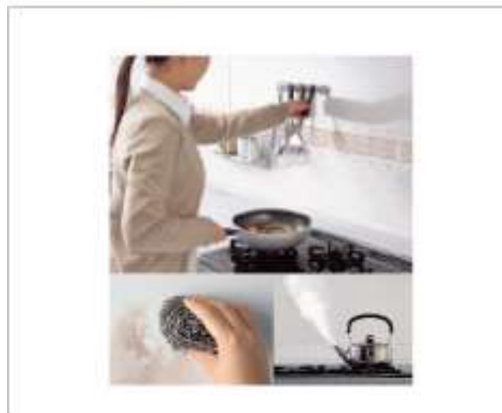
ホーロー製キッチンパネル

ホーローは表面がガラス質なので水や汚れが染み込みません。表面の汚れはゴシゴシ擦っても大丈夫磁石が付くからマグネット収納なども付かれて便利です。