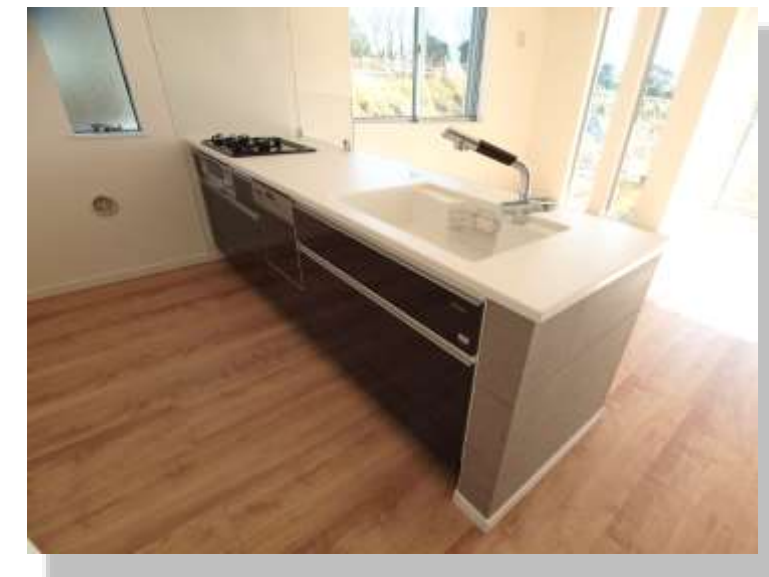
キッチンパネル LNU-2664CM 施工例