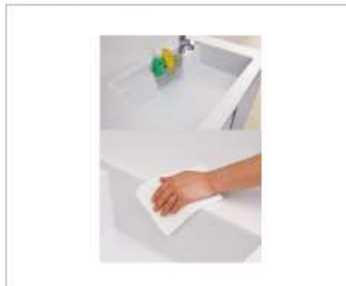
アクリル人造大理石シンク

硬く熱にも強い耐久性に優れた材質です。180℃の油が入った鍋を置いても変色しません。(メカ実験結果)ワークトップとの段差や隙間が無いのでお手入れも簡単です。