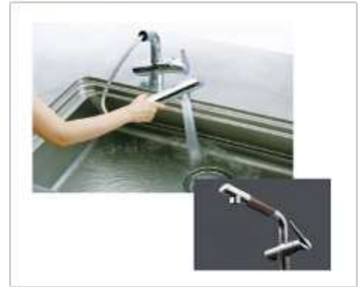
浄水器内臓ハンドシャワー水栓

高級感あるデザイン、機能的にも引き出せて隅々まで洗浄できます。浄水カートリッジを内臓できるのでお水を購入しないで飲料水を生成できます。