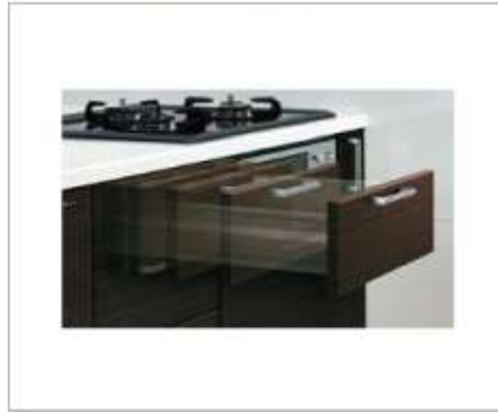
ソフトクローズ機構

引き出し式なので、奥の物も取り出しやすく調理器具や食器などの小物を見やすく整理することができます。