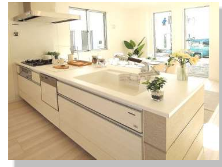
キッチンパネル ANU-2665CM 施工例