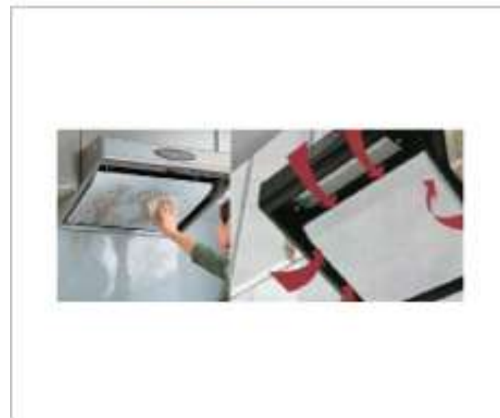
ホーロー整流板付レンジフード

すきま風現象を利用した整流板の効果で吸引力がアップ。ホーローなので整流板についての頑固な汚れもサッととれ、お手入れも簡単にできます。