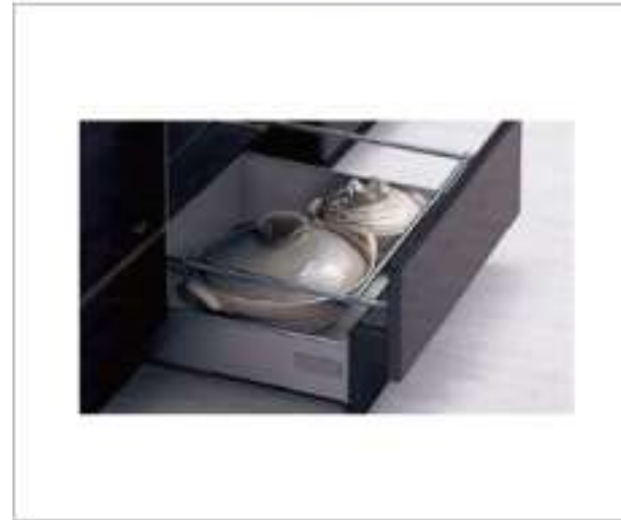
フットスペース収納

足元まで余すところなく収納力を確保、重たい物も収納できます。ストック類や普段使わないものを分類して収納できます。